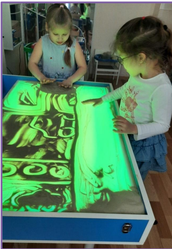
Рисование на песочном планшете