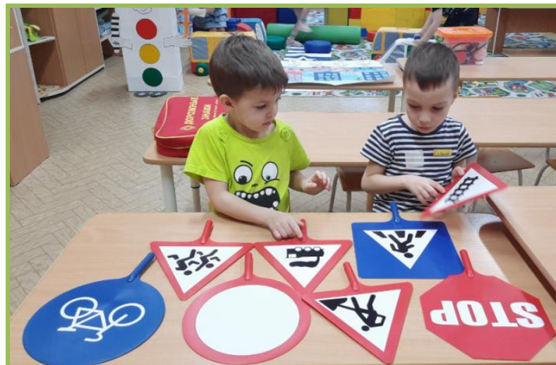
Дидактическая игра «Угадай знак»