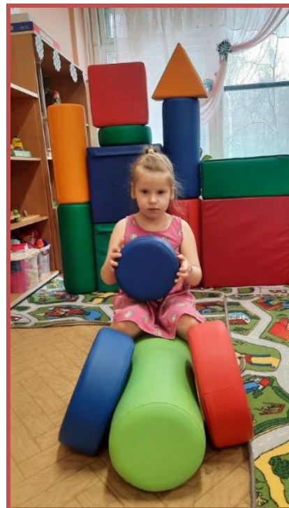
Конструирование из модулей