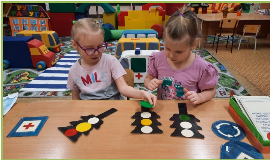
Дидактическая игра «Светофор»