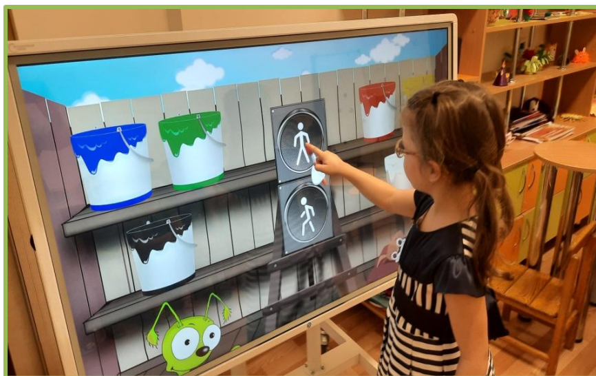
Изучение ПДД с использованием программно-аппаратного комплекса «Колибри»