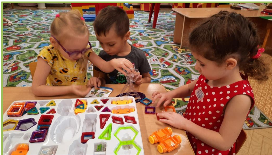
Конструирование «Транспорт нашего города»