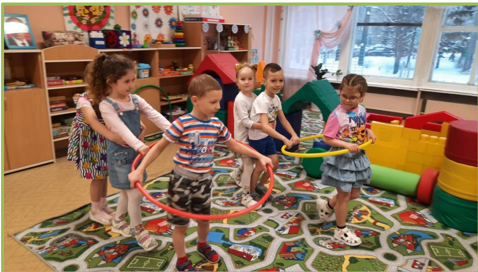
Подвижная игра «Перевези пассажиров»