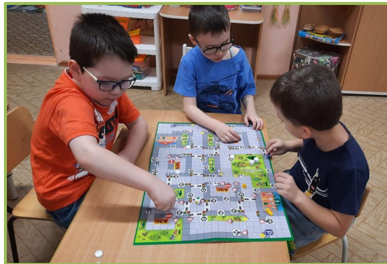
Игра-ходилка для изучения ПДД