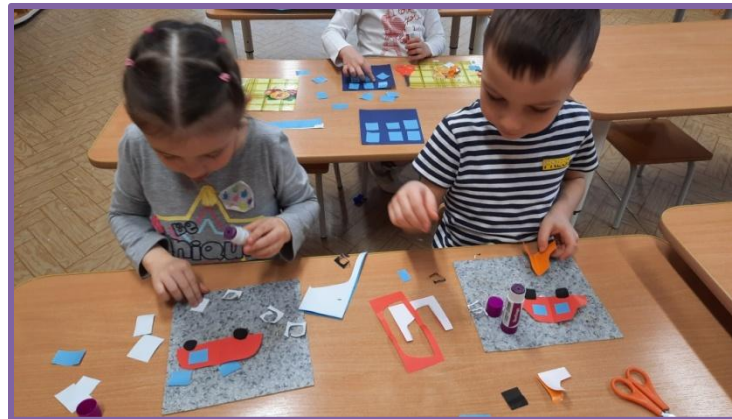
Коллективная работа «Улицы нашего города»