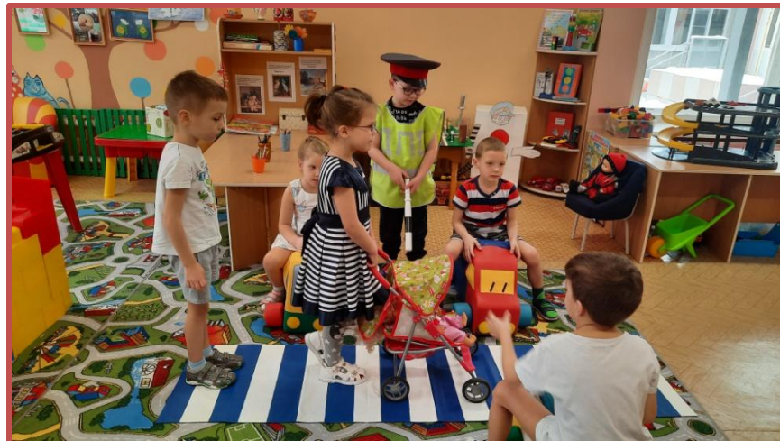
Игровая ситуация «Пешеходная зебра»