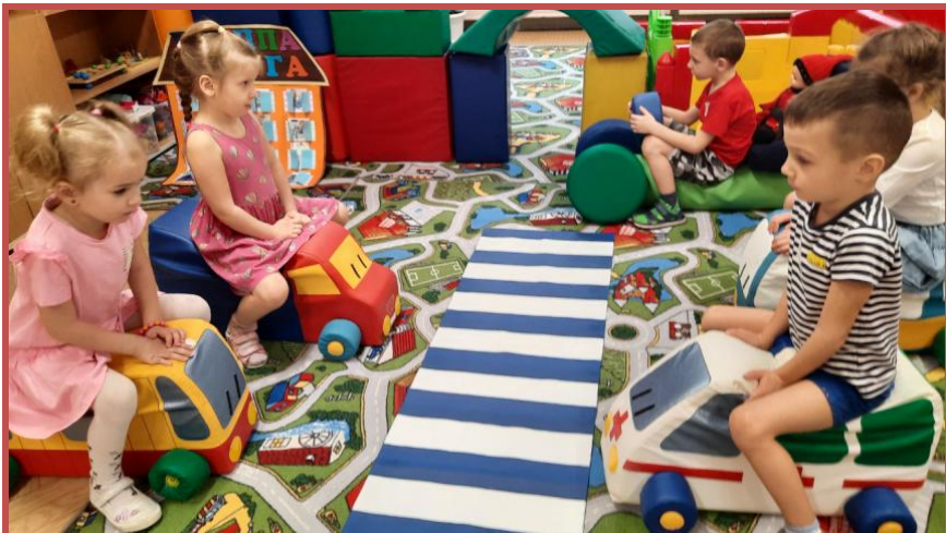
Сюжетно-ролевая игра «Автошкола»