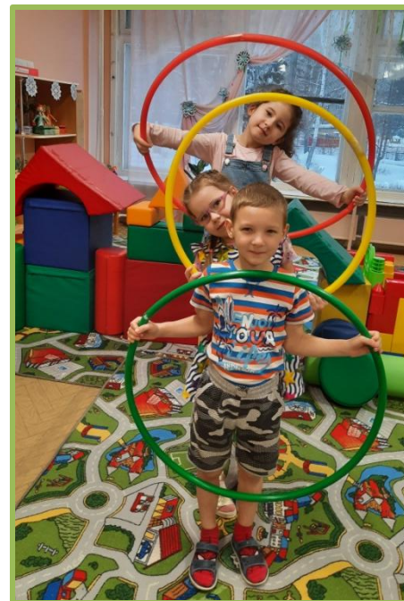
Подвижная игра «Найди свой цвет»