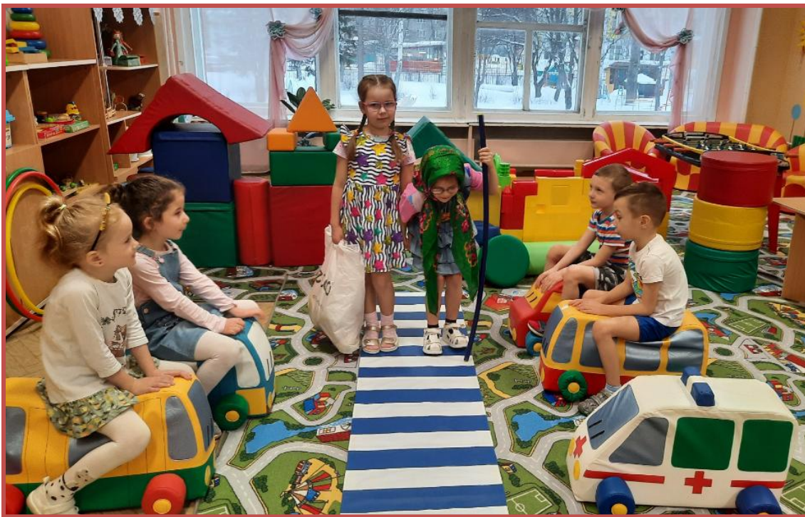
Игровое упражнение «Помоги бабушке перейти дорогу»