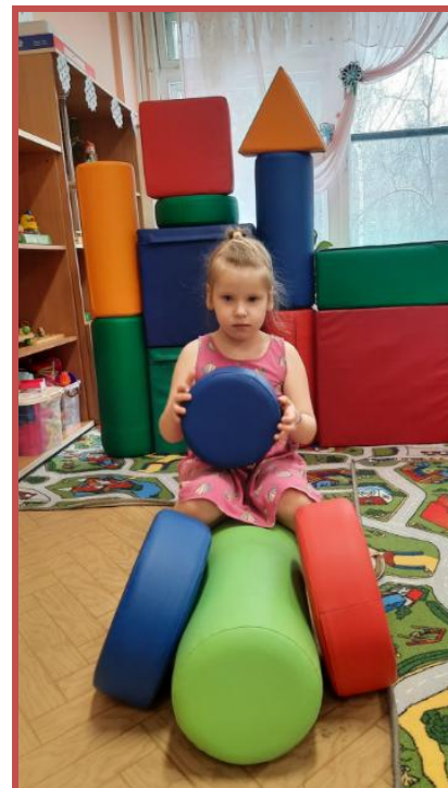
Конструирование из модулей