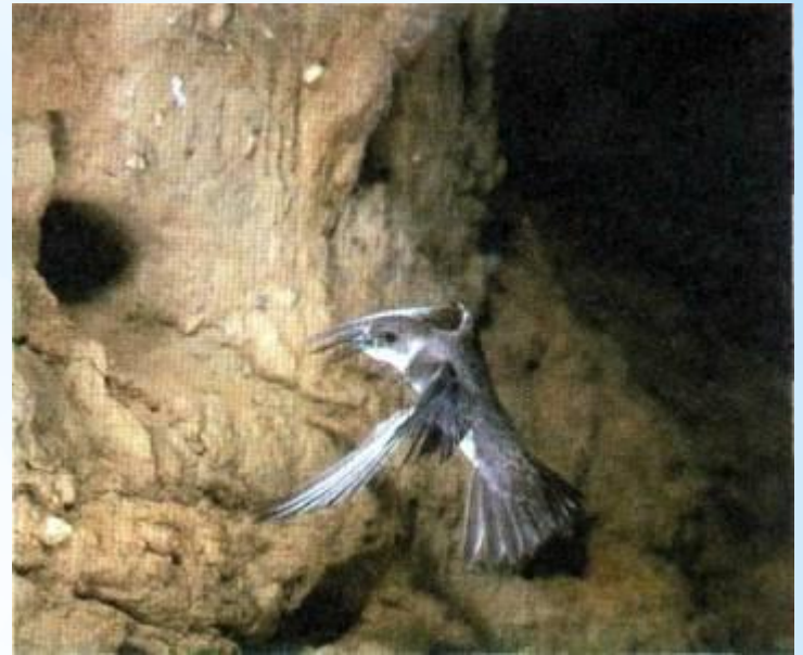
Гнездо береговой ласточки

Гнезда ласточек очень интересно построены. Особенно хорошо строит гнездо городская ласточка. Она так искусно лепит из глины, смоченной слюной, шарообразное гнездышко, что оно может оставаться целым в течение нескольких лет; прочность его очень велика.